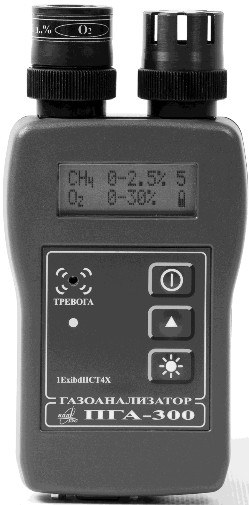
Общий вид ПГА-300 с двумя установленными датчиками